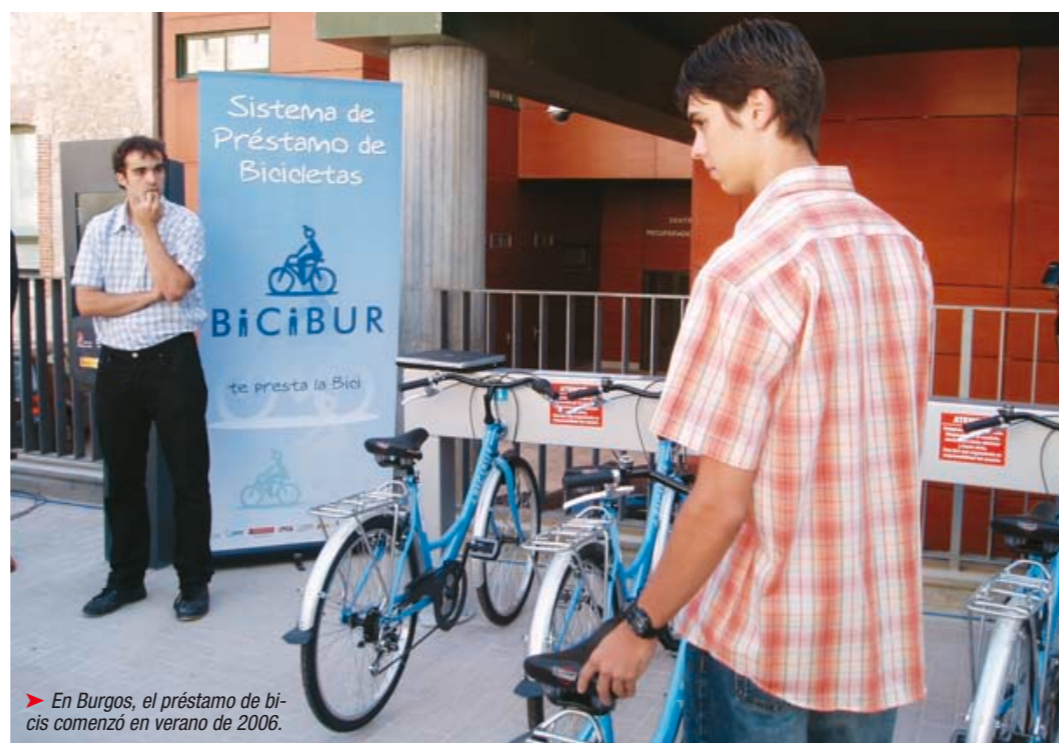
► En Burgos, el préstamo de bicis comenzó en verano de 2006.

IMPLANTACIÓN PROGRESIVA. En España, la referencia en implantación de la bici es San Sebastián. La capital guipuzcoana empezó a introducir la bici hace más de 15 años. “En 2000 eliminamos un carril para coches en favor de la bici en una zona muy transitada. En dos años, la circulación de bicicletas se dobló en ese tramo y aumentó un 50% en