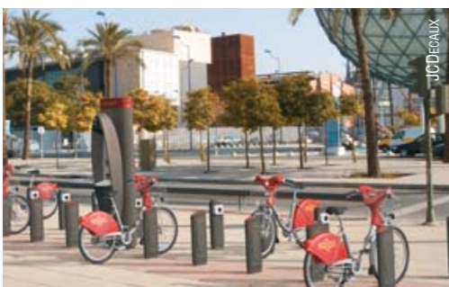
► Gijón (arriba) y Sevilla (debajo) cuentan con ‘bicis públicas’.

pero esto no ocurre de un día para otro”. Y eso lo saben bien en Alemania, Francia, Gran Bretaña o en los países escandinavos, donde las bicicletas son habituales desde hace años y no sólo en ciudades pequeñas, sino en grandes capitales atestadas de coches, como por ejemplo Copenhague (un millón de habitantes).