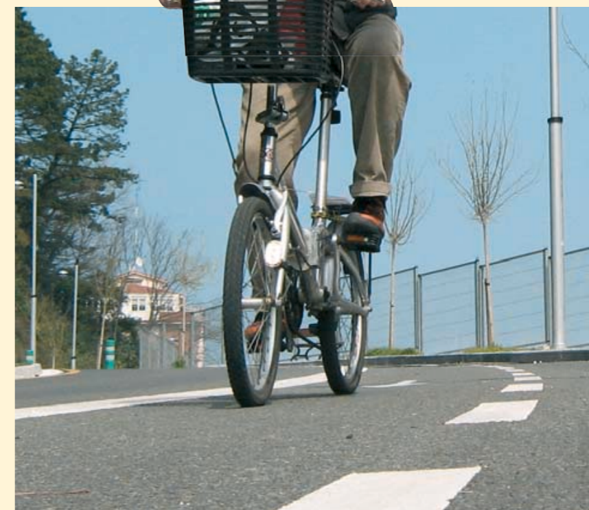
► La bici, una forma cómoda y eficaz de desplazarse en ciudad.